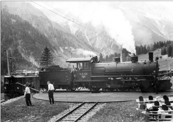
G 4/5 108 auf der Drehscheibe in Pre- da. Ernst Hasler steht XXXX