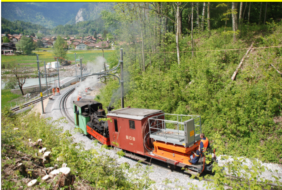
Dampfzug zurück vom Fahrleitungsbau.

Nachrichtenblatt der Modelleisenbahnfreunde „Eiger“ Zweilütschinen Juli 2009 33. Jahrgang Ausgabe 1/2009