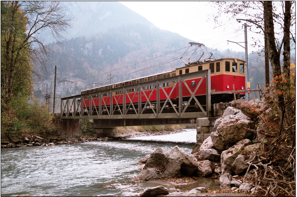
Alte Brückenlage am 25. September 2008 mit He 2/2 19