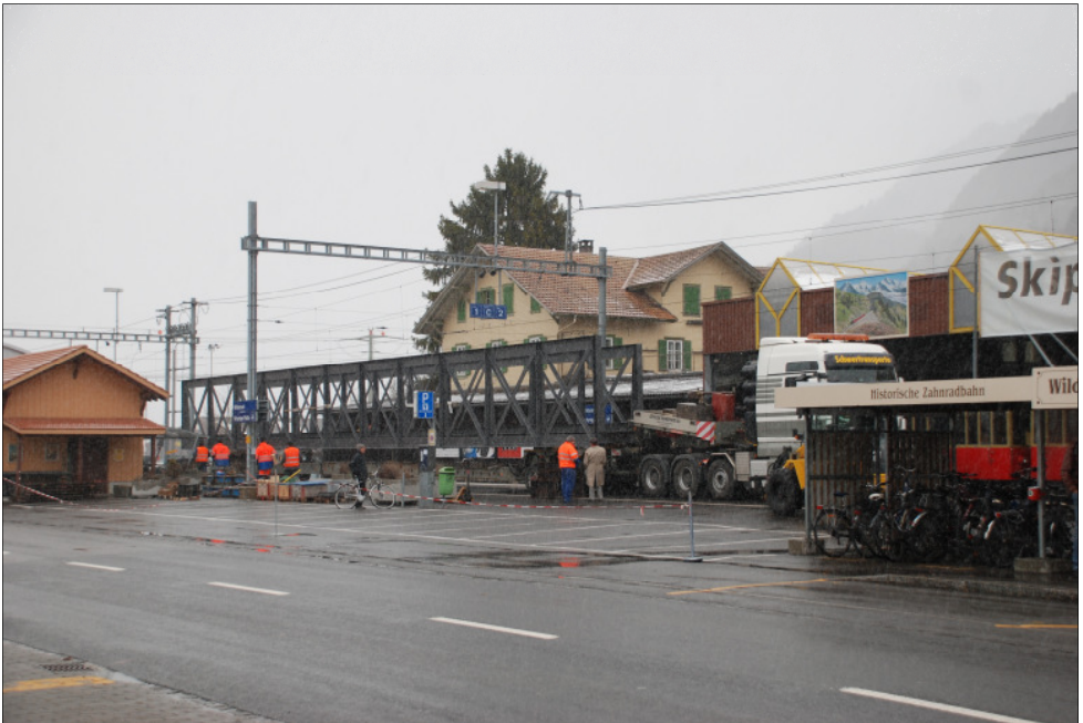
Oben: Revidierte SPB-Brücke im Bahnhof Wilderswil