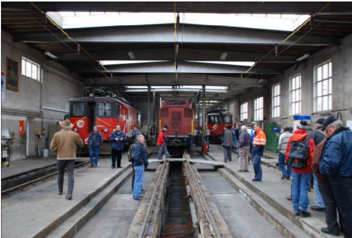
Die MEFEZ-Gruppe in einer Halle der Werkstätte ZB in Meiringen

Die anschliessende traditionelle Tombola erfuhr wieder reges Interesse und die Anwesenden genossen das anschliessende Nachtessen.