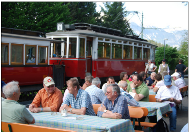
Zvieripause in Igls

Der letzte Tag stand im Zeichen von Bergbahn und See. Auf der Hinfahrt nach Jenbach sahen die Teilnehmer die erste kommerzielle Fahrt einer BLS Re 486 in Österreich. Die Dampflokomotive Nr 2 der Achenseebahn war angeheizt und brachte uns rasch und ohne Probleme zum Achensee. Die unterhaltsame Art des Zugbegleiters/Skilehrers verkürzte die Fahrt. Am Achensee bestiegen wir das Schiff, welches uns über den Bergsee nach Achenkirch brachte. Ein Jausenbrettl beim Fischerwirt inkl. eines kleinen Schnäpschens unterstützte die fröhliche Fahrt per Schiff und Bahn ins Tal. Die Rückfahrt am Mittwoch führte die MEFEZ'ler über den Arlberg in die Schweiz.