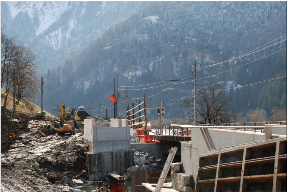
Oben: Neue Brückenköpfe im Februar 2009